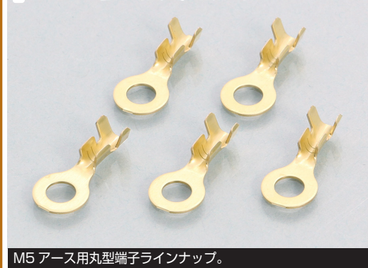
M5 アース用丸型端子ラインナップ。