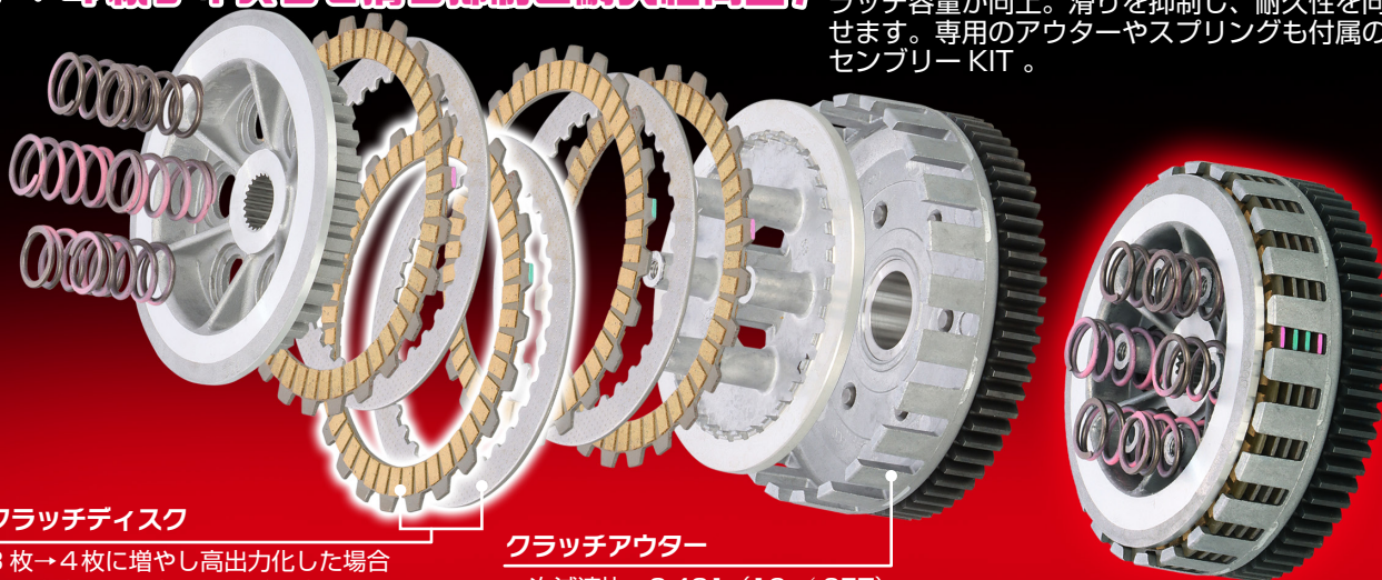
クラッチディスク

ノーマルクラッチのディスク数を増やす事でクラッチ容量が向上。滑りを抑制し、耐久性を向上させます。専用のアウターやスプリングも付属のアセンブリーKIT。