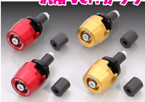
アルミ削り出しボディにベアリングを内蔵。軽くクルクル回転しドレスアップ効果もアップ。遊び心溢れるアイテム!! 市販のφ22.2 スチールハンドル、アルミハンドルに対応する汎用タイプのスピナーバーエンドがリリース!!

ベアリング内蔵! クルクル回る! スピナーバーエンドの 汎用 Ver. がリリース!!