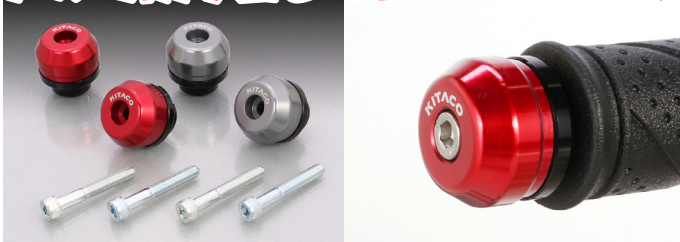
アルミ削り出し 2 ピースバーエンドキャップリリース。