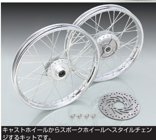
キャストホイールからスポークホイールへスタイルチェンジするキットです。

※デモ車には2POT キャリパー ASSY (レッド: 500-1310220) を装着しています。